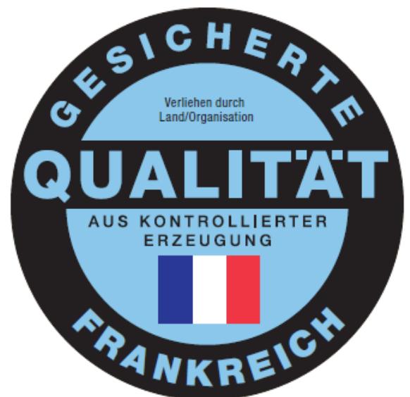
Qualitätszeichen am Beispiel Frankreich

Das Zeichen ist in schwarzer Farbe auf blauem Grund (Pantone 2905) abgebildet. Eine Verwendung des Zeichens in anderer Farbgebung ist in Abstimmung mit dem MLR möglich.