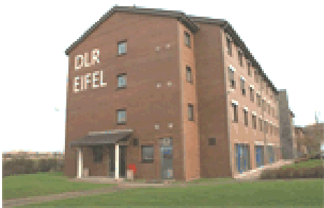
DLR Eifel Bitburg