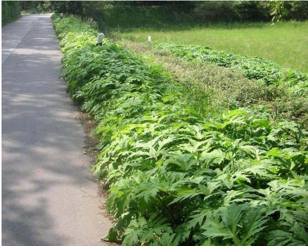
Ausbreitung trotz zweimaliger Mahd pro Jahr im Ruhrtal bei Witten