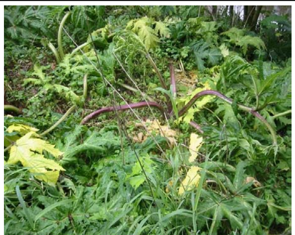
Typische Symptome 1-2 Wochen nach Triclopyr-Behandlung

Sind die Stauden für eine Behandlung schon zu hoch, kann vorher gemäht und dann der Neuaustrieb behandelt werden. Wird erst kurz vor der Blüte gemäht, dann wachsen nur Notblüten nach und es fehlt die Blattmasse für eine chemische Behandlung.