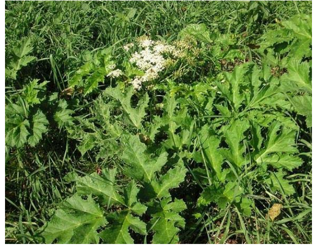
Kaum sichtbare Notblüte nach der dritten Mahd der Wiese